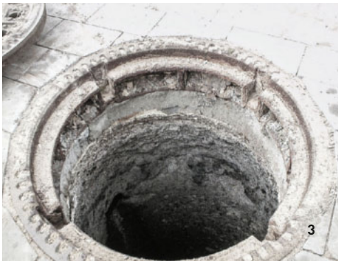
1+2 Wasserhochdruckdüse / 3 Schacht vor Reinigung / 4 Schacht nach Reinigung / 5 Schacht nach Beschichtung

Zusätzliche Sicherheit erhalten die Auftraggeberin bzw. der Auftraggeber durch die elektronische Aufzeichnung der ausgeführten Arbeiten und den Erhalt eines Arbeitsprotokolls über jede Sanierung oder Reinigung.